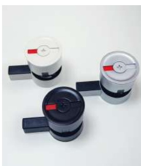
Serrure libre / occupée en aluminium avec poignée de porte : blanc / noir / aluminium naturel