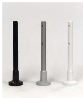
Pieds en aluminium avec vérin en acier inoxydable et rosace en nylon