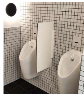
Séparations d'urinoir assorties