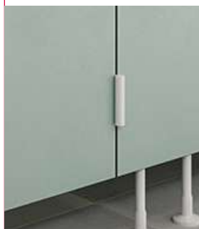
Charnière en aluminium à fermeture automatique incl. soft close