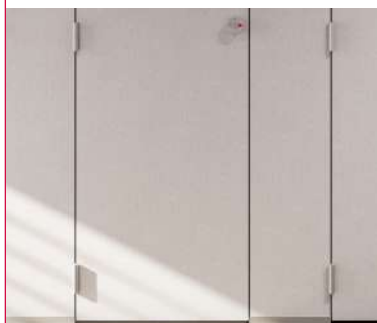
Charnière en aluminium à fermeture automatique incl. soft close