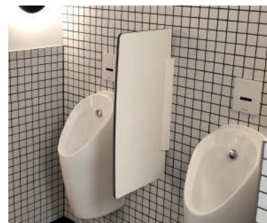
Séparations d'urinoirs assorties aux cabines