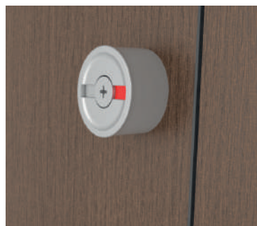
Serrure libre / occupée en aluminium avec poignée de porte : blanc / noir / aluminium naturel