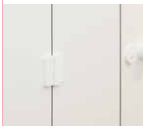
Paumelle hélicoïdale en nylon avec système d'amortissement Intégré.