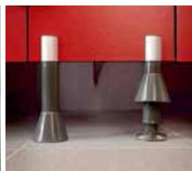
Pied vérin en nylon