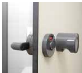
Bouton de porte fixe et verrou en nylon