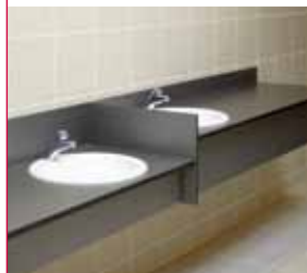
Hoogte aangepast aan verschillende gebruikers