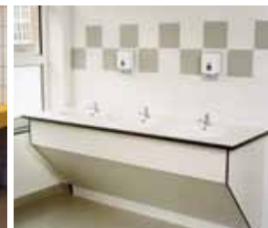
Speciale uitvoering op maat