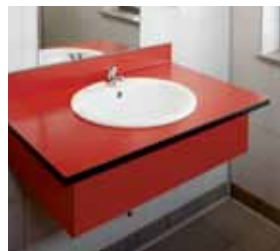
Vrijhangend met zijkantafwerking